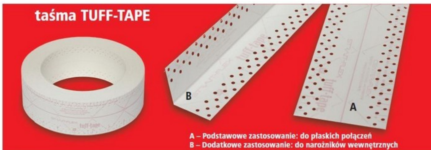
A – Podstawowe zastosowanie: do płaskich połączeń B – Dodatkowe zastosowanie: do narożników wewnętrznych